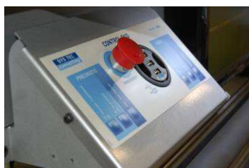
Nuovo pannello comandi