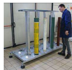
SYS-Sleeve Smart Storage