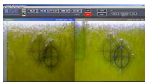
Esempio di montaggio con Virtual Image